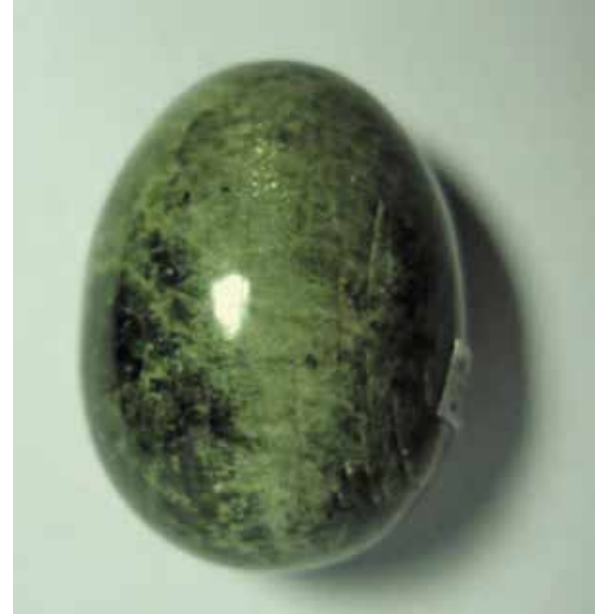
Корунд 2,6 см. Бурятия