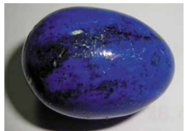
Лазурит. 4,5 и 2,8 см. Сары-Санг, Афганистан