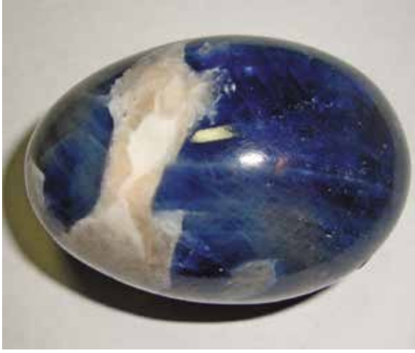
Корунд синий с альбитом. 6,5 см. Ильменские горы, Челябинская обл.