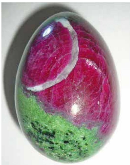
Корунд красный с хром-цоизитом. 6 см. Мундара, Танзания