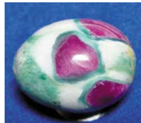
Корунд красный с фукситом. 2,3 см. Майсур, Индия