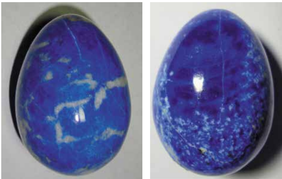
Лазурит. 5,5 и 3,9 см. Ляджвар-Дара, Таджикистан