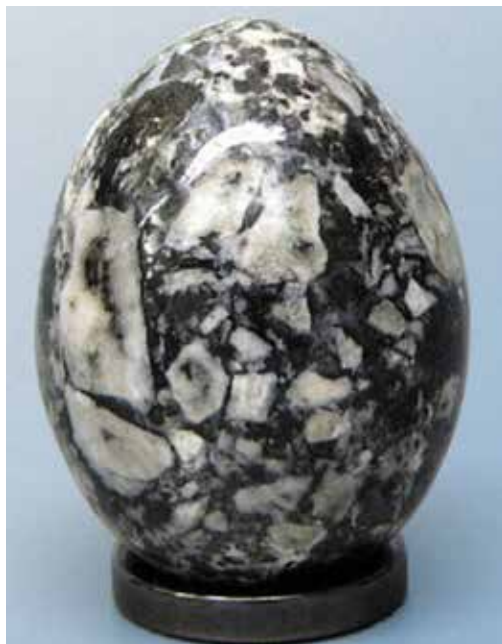
Ковдорскит (белый). 4 см. Ковдорское, Мурманская обл.