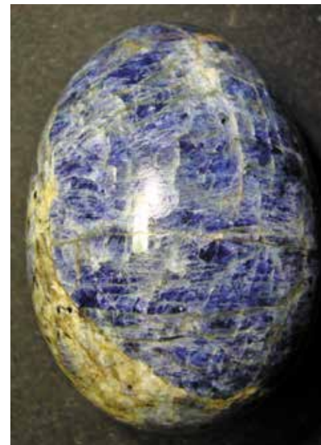
Кордиерит. 5,5 см. Ясатер, Респ. Алтай