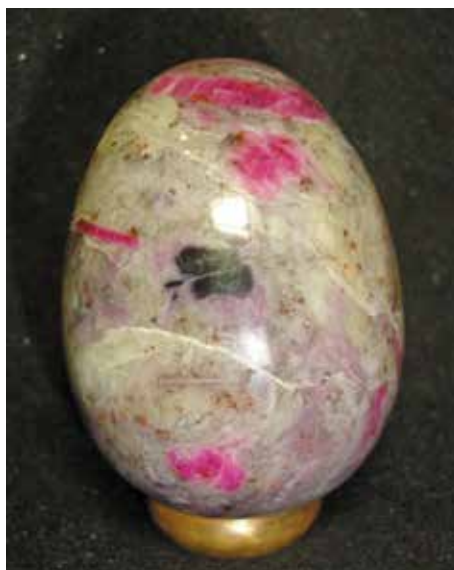
Корунд красный в кварце. 5,4 см. Карнатака, Индия