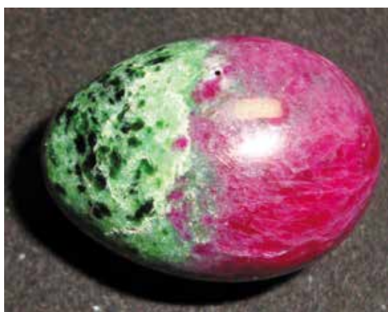
Корунд красный с цоизитом. 2,8 см. Мундара, Танзания