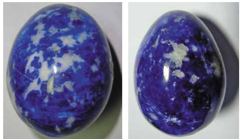
Лазурит и кальцит. 4,5 и 3,3 см. Малобыстринское, Иркутская обл.

Яркий и сверкающий при дневном свете, лазуриит становится темным и мрачным при свечах и электричестве. Недаром его красота ценилась больше всего на юге, где роскошь и пышность убранства была рас- считана на солнечный свет.