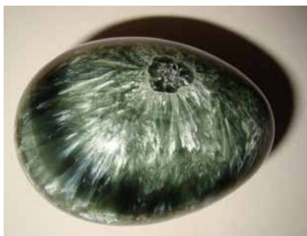
Клинохлор (хлорит). 6,5 см. Коршуновское, Иркутская обл.