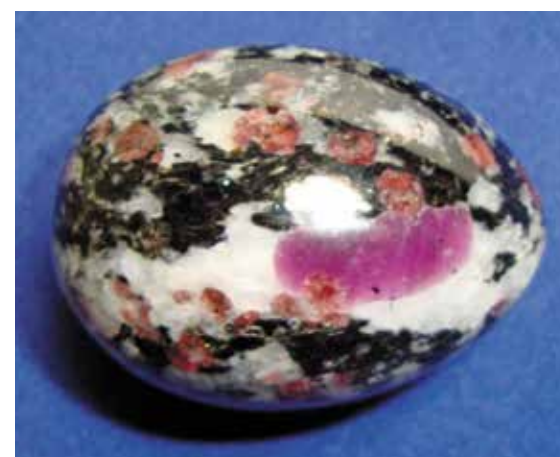
Корунд красный в гранатовом гнейсе. 4,5 см. Хит-Остров, Карелия