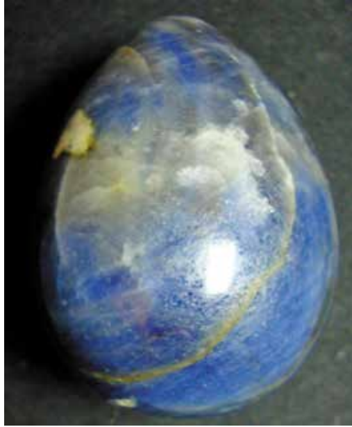
Корунд 5,1 см. Будунское, Иркутская обл.