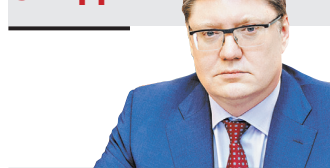
Андрей Исаев заместитель руководителя фракции «Единая Россия» в Государственной Думе

СМИ Россия и Беларусь запустили новый телеканал и цифровые медиа