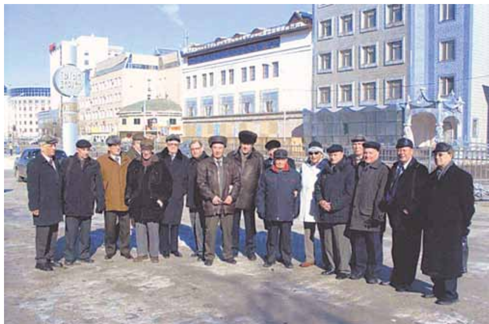
Ветераны ПГО «Якутскеология» на праздновании 50-летия геологической службы Якутии. Якутск, 2007 год, у гостиницы Тыган-Дархан.